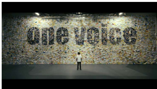
降谷建志／「One Voice」ミュージックビデオ

特設サイトURL: https://www.audio-technica.co.jp/atj/sc/solidbass/sstv/