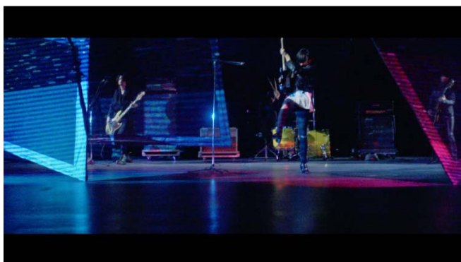
[Alexandros]／「Girl A」ミュージックビデオ