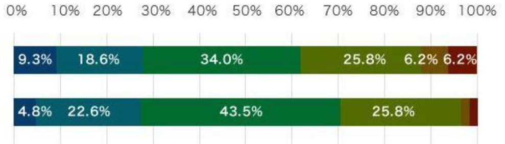
(グラフ4) 仕事への取組み特徴

■ とてもあてはまる ■ あてはまる ■ ややあてはまる ■ ややあてはまらない ■ あてはまらない ■ まったくあてはまらない