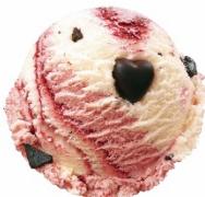
ラブポーションサーティワン (レギュラー-シングルカップ) 640円