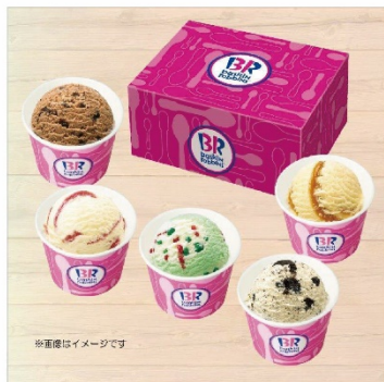
レギュラーカップ 5 個セット A 2,750円

キャラメルリボン、ポップリングシャワー、ストロベリーチーズケーキ、クッキーアンドクリーム、チョップドチョコレート 各 1 個ずつの人気フレーバーセットです。