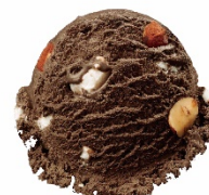
ロッキーロード® (レギュラー-シングルカップ) 640円

アーモンドとマシュマロ、チョコレートで雪解けのロッキー山脈のでこぼ道表現した商品です。