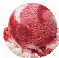
ストロベリースペシャルタイム (レギュラー-シングルカップ) 640円

ポップロックキャンディが弾ける、ミントとチョコの風味の人気 No.1 のフレーバーです。