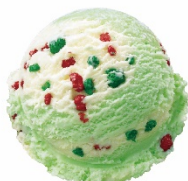
ポップリングシャワー 640円

キャラメルリボン、ポップリングシャワー、ストロベリーチーズケーキ、クッキーアンドクリーム、チョップドチョコレート 各 1 個ずつの人気フレーバーセットです。