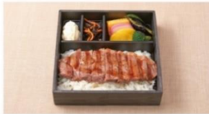
ステーキ弁当 ¥1,500 ⇒ ¥1,200*