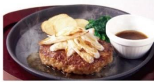
和風ハンバーグ(ライス・爽健美茶付き) ¥950 ⇒ ¥650*