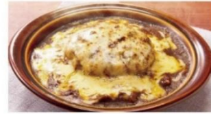
ハンバーグカレードリア ¥900 ⇒ ¥600*