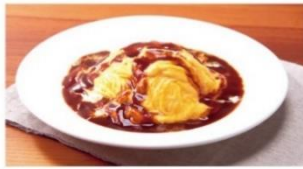
とろ〜り卵とチーズのオムライス ¥900 ⇒ ¥600*