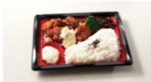
チキン南蛮弁当 ¥850 ⇒ ¥550*