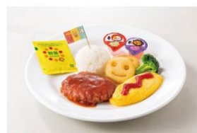
5位 おこさまランチ (ゼリー・おまけつき) 450円

※価格はすべて税込みです。 ※「デニーズ」の2019年5月の 商品出数を元に 独自の算出方法で集計。