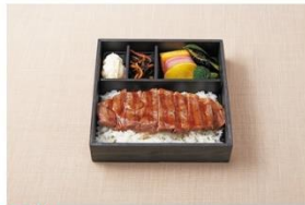
2位 ステーキ弁当 1,500円