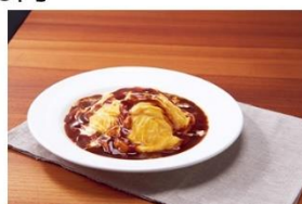
4位 とろ〜り卵とチーズのオムライス 1,000円