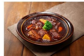
3位 トロけるお肉のビーフシチュー 1,400円