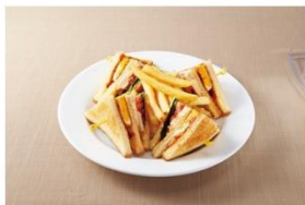
1位 アメリカンクラブハウスサンド 1,000円