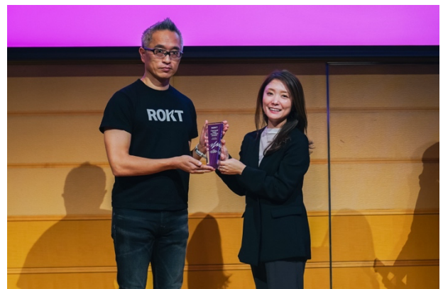
「Rokt Ecommerce Partner of the Year Awards」授賞式の様子