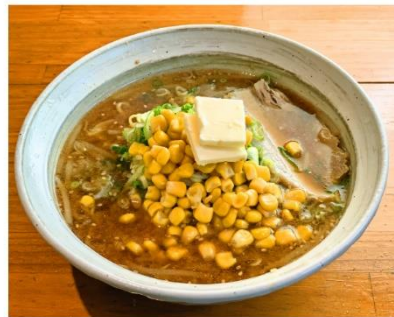
味噌コーンバターラーメン 1,250円