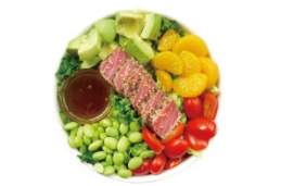
SALADSTOP! TUNA SAN【ツナサン】 1,550円