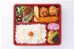
まいどおおきに食堂 エビフライ&唐揚げ弁当 900円