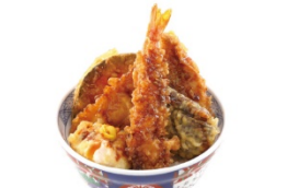
えびのや 海老一本丼 860円