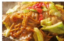
じゅうじゅう屋 ふた焼そば 990円