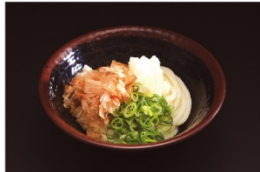
つるまる 《温》ぶっかけうどん 450円