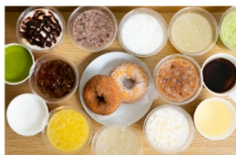
ハニーミツバチ珈琲 はちみつコーヒー 450円