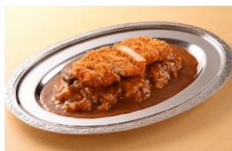
かつかつカレー-888 シングルトッピング カレーロスカツ 870円