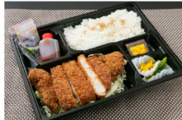
かつ満 ロスカツ弁当 940円