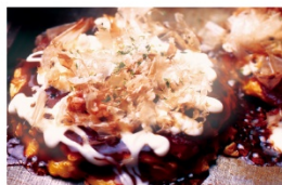
お好み焼き 葉月 ふた玉 810円