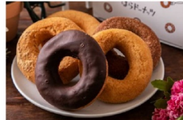
はらドーナツ ドーナツ5個セット 900円