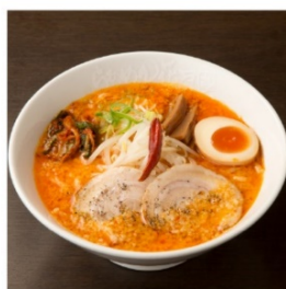
嵐げんこつバリ辛 らあめん塩 RX 1,040円