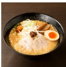
嵐げんこつらあめん RX 890円