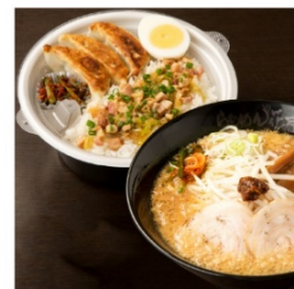
嵐げんこつらあめん RX (醤油・味噌・塩) 餃子3個・ぶためしセット 1,360円