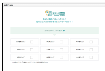
電気代削減シミュレーション画面