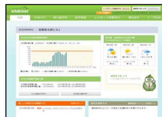
電力見える化サービス 「いんぷおエネット」