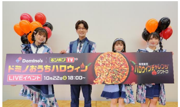
左から：なる、よっち、どみちゃん、いっちー

https://www.youtube.com/channel/UC6VVSFaHYbR-bhNer7DXxGNQ