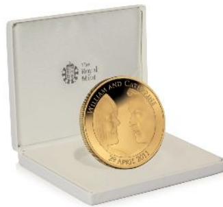
D 5ポンド金メッキ銀貨 価格:15,750円