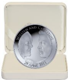
C 5ポンドピエフォー銀貨 価格:21,000円