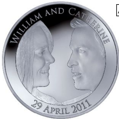
A 5ポンドプラチナ貨 価格:1,102,500円