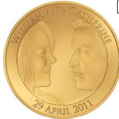
B 5ポンド金貨 価格:346,500円