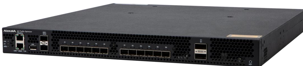
トラフィック最適制御装置 (AX-Traffic Optimizer) の外観