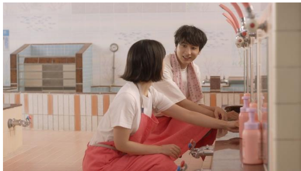
新TV-CM 「二人のこれから」篇より

「小さな常連さん」篇では、小さな男の子に対して、アキとトシがあたたかい笑顔で話しかけている様子や、CM最後になっこりと視線を合わせる姿にほのぼのしてしまいます。