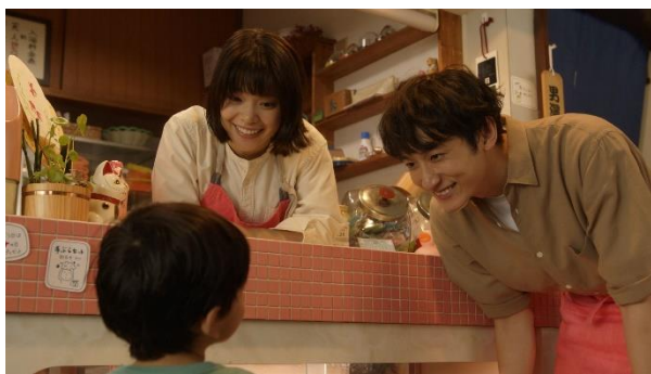
新TV-CM 「小さな常連さん」篇より