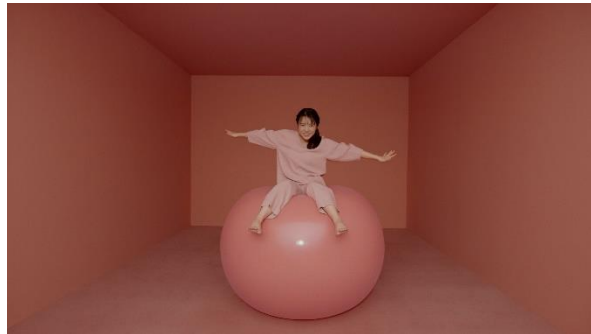
新TV-CM 「ゆらがんぞ」篇より