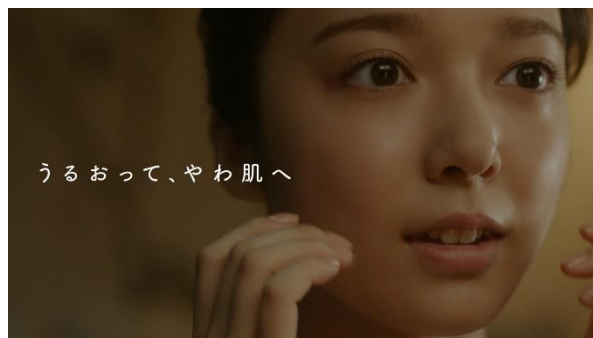
新TV-CM「ゆらがんぞ」篇より

第一三共ヘルスケア株式会社は、敏感肌向けスキンケアシリーズ「ミノン」において、新たなイメージキャラクターを迎えたボディケアシリーズ・フェイスクケアシリーズの新TV-CMを、2020年9月28日（月）に全国にて放映開始いたします。ボディケアシリーズとしては、俳優・岸井ゆきのさんと小関裕太さんを起用したミノン全身シャンプー「二人のこれから」篇・ミノン全身保湿剤「小さな常連さん」篇、フェイスクケアシリーズとしては、上白石萌音さんを起用したミノン アミノモイスト「ゆらがんぞ」篇を展開いたします。