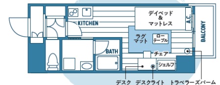
◆家具設置イメージ 【例】アルク大和町 II : 1R タイプ(24.3㎡)

ブラックやダークブラウンといった色味をベースに使い、重厚感の中に洗練された雰囲気醸し出しています。