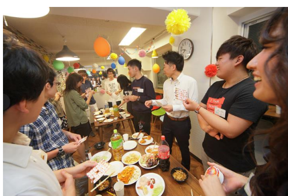
ウェルカムパーティの様子(他施設)