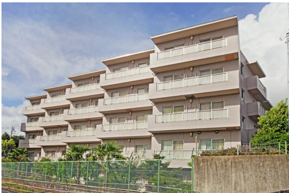
Re : bar machida（リバー・マチダ）