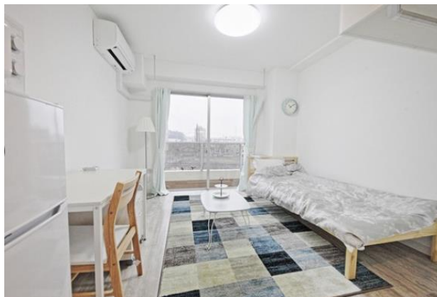
居室モデルルーム