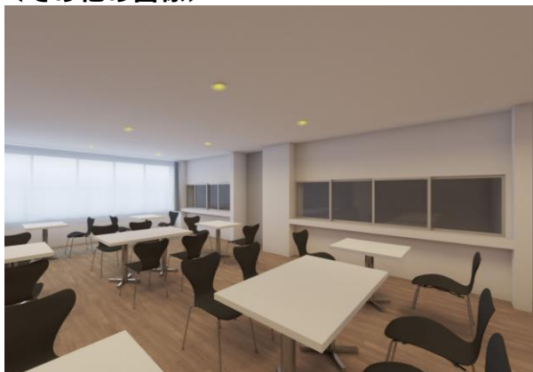
食堂完成イメージ