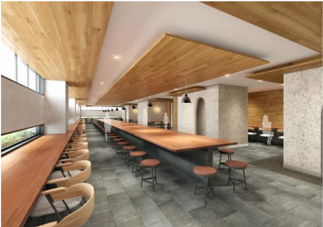
▲食堂ラウンジ完成予想 CG

食堂ラウンジにはひとつの大きなテーブルを配置。ひとつの大きなテーブルは学生同士を繋ぐ仕掛けになります。向こう三軒両隣、その時々で近くにいる学生が変わり、新たな関りを見つけることができます。みんなで囲うことで、様々な価値観を持った学生たちが交流を深めていきます。