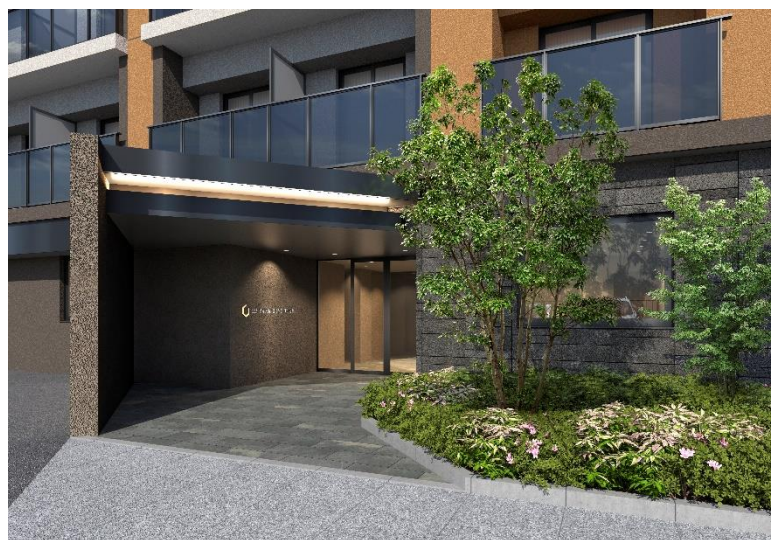
▲アプローチ完成予想 CG