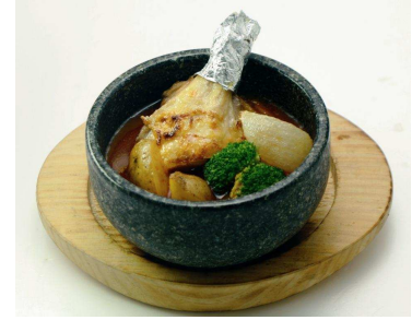
石焼チキンカレー煮 ¥515 円(税込)