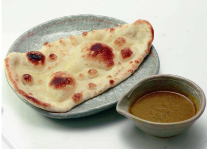
ナンカレー ¥336 円(税込)