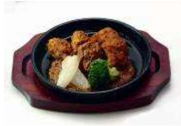
純和鶏カレー煮込 ¥515 円(税込)