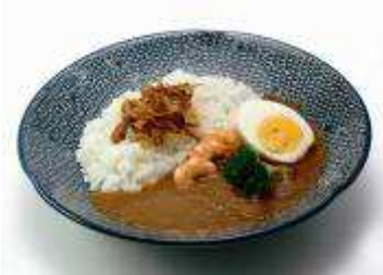
ヨーロピアンカレー ¥410 円(税込)