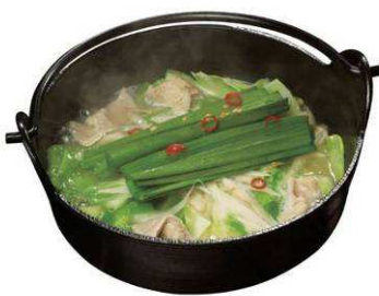
＜牛もつ鍋＞ ※養老乃瀧