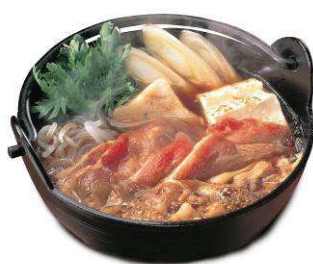
＜牛すきやき鍋＞ ※養老乃瀧