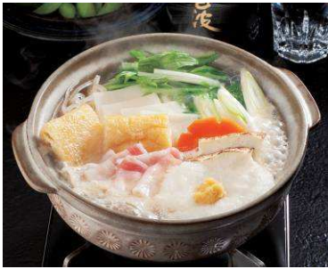
＜雪見しょうが鍋＞ ※だんまや水産