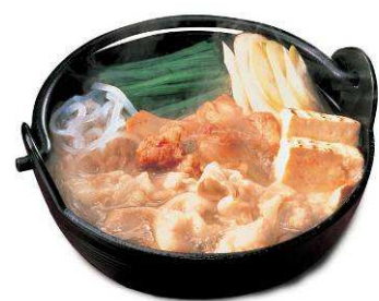
＜キムチ鍋＞ ※養老乃瀧