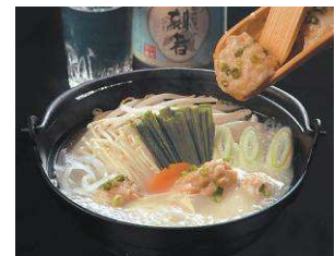
＜純和鶏塩ちゃんこ鍋＞