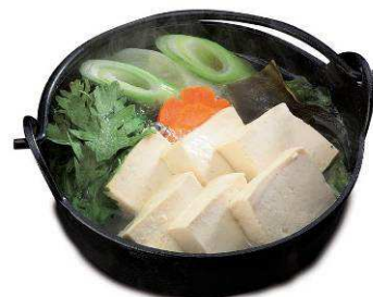
＜湯豆腐鍋＞ ※養老乃瀧