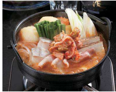
＜餃と北あかりのキムチゲ鍋＞ ※だんまや水産