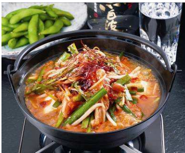
＜激辛純和鶏チゲ＞※二の酉

この機会に是非、養老乃瀧にご来店頂き、養老乃瀧グループだからこそ提供が可能な低価格高品質のお料理とお酒をお楽しみ下さい。