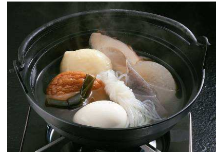
＜激辛チゲ鍋＞ ※二の酉