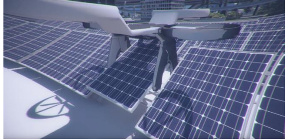
【ソーラーパネル交換ドローン】