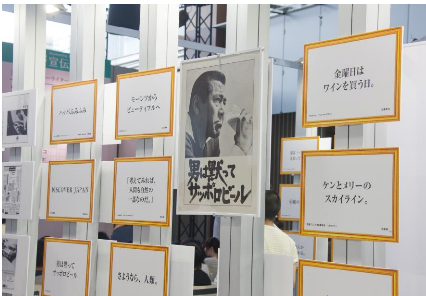
過去 60 年の名コピーや広告を展示 (東京会場)