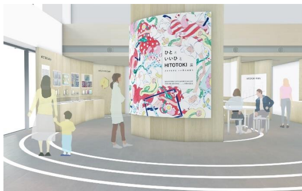
つながりをイメージした会場

「HITOTOKI」は、2017年4月に立ち上げた文房具ブランドです。「ほんのひとてま加えることで、暮らしが少し豊かになる商品」というコンセプトのもと、持っているだけで嬉しくなったり、使うほどに愛着が湧いたりするような「暮らしの中の“ひととき”がたのしくなる」マスキングテープ、シール、ノートなどのアイテムを展開しています。