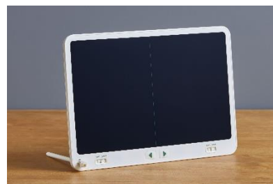
スタイラススタンド使用時