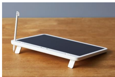
チルトスタンド使用時