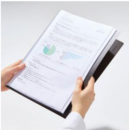
表紙を 360° パタンとしなやかに折り返せる

「クリアファイルパタント」は、やわらかい背パーツを採用しているため、表紙を 360° 折り返すことが可能な閲覧性の高いクリアファイルです。表紙を折り返せるため片手でも持ちやすく、プレゼンテーション時の使用にも便利です。また、狭いデスクの上でも省スペースで使用できます。