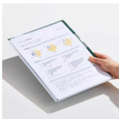
ハード素材で書類をしっかりと守る

「スーパーハードホルダー」は丈夫なシートを採用した、書類をしっかりと保護するハードなホルダーです。厚さ 1.3mm の丈夫なシートを採用し、本棚・引き出し・カバンの中でも書類を折れ曲がりから保護します。また、裏面には書類ストッパーが付いており、下敷きとしての使用も可能です。3山と5山のインデックスタイプは、書類の分類にも便利です。