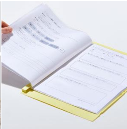
パラパラとめくって閲覧できる