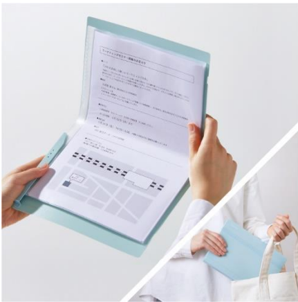
A4書類を二つ折りにして コンパクトに持ち運べる

「クリアファイルコンパック」はA4サイズの書類を半分のサイズに折りたたみ、コンパクトに持ち運べるファイルです。折りたたんでも書類に折り目がつきにくい設計で、開くと通常のクリアファイルと同様に、書類をパラパラとめくって閲覧できます。