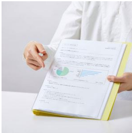
片手でも持ちやすく プレゼンテーションにも便利