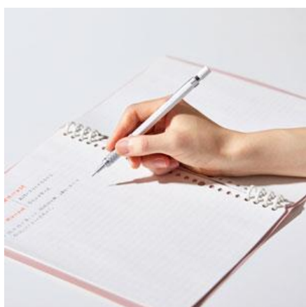
セパレート式のリングで、 書くときに手にふれない

「リングノート テフレーヌ」は、ルーズリーフの差し替えが可能なリングノートです。とじ具のリングが上下にセパレートしているため、書くときにリングが手に触れません。また、リングをつまむだけでとじ具を開けることができ、市販のルーズリーフの追加・差し替えが可能です。