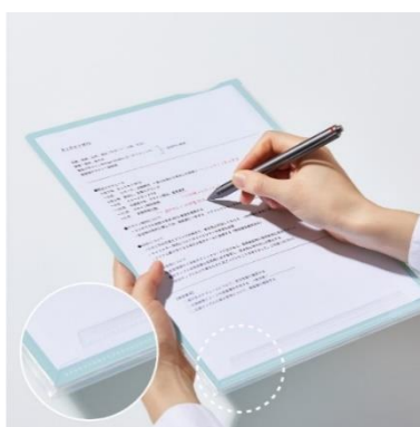
裏面にペーパーストッパー付きで 下敷きとしても活用できる