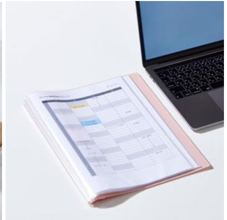
卓上でも省スペース