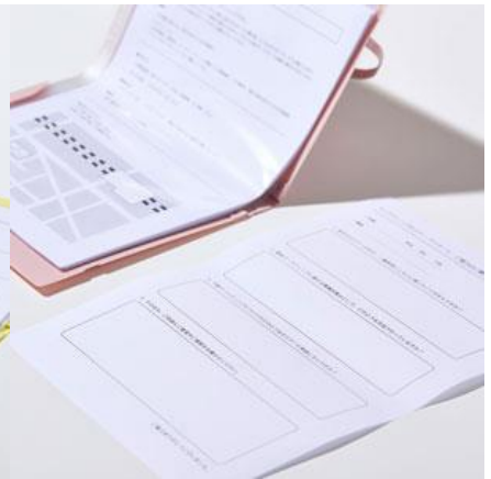
書類に折り目がつきにくい