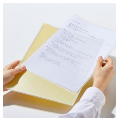
A4 サイズのホルダーを収納できる