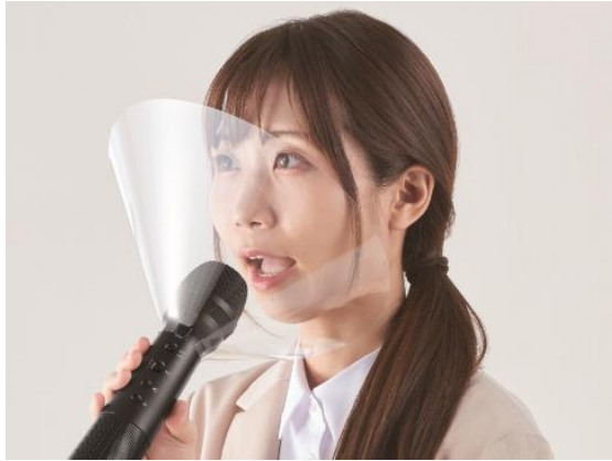
マイクシールド使用シーン