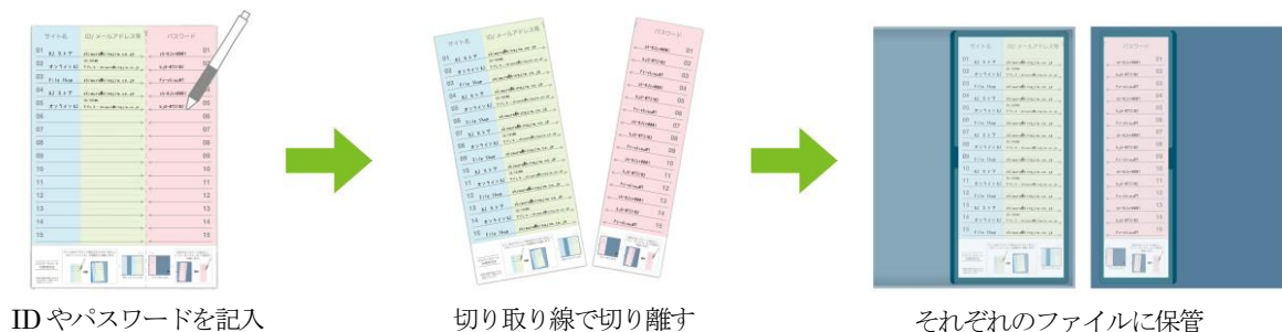
IDやパスワードを記入

Web サイト等のログインに必要な「ID/ユーザー名」と「パスワード」を別々に管理できる、パスワードシートを2枚付属しています。シートはID/ユーザー名とパスワード部分を切り分けることができ、ポケットファイルとフリーボックスにそれぞれ保管します。