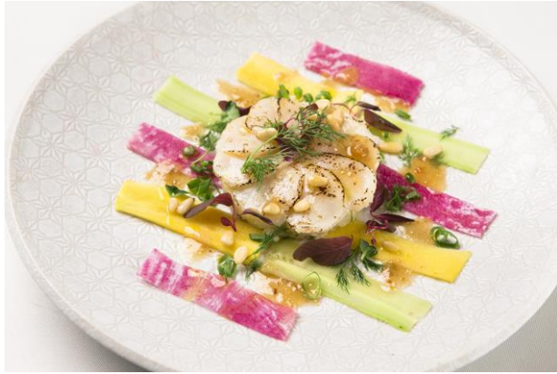
マッシュポテトと帆立のグラタン 「テプラ」スタイル 「テプラ」テープをイメージした野菜で彩られた前菜

「テプラ」テープをイメージした、期間限定のオリジナルコラボメニューをご提供します。さらに、オリジナルメニューをご注文いただいたお客様のうち、毎日先着 100 名様に、「テプラ」ミニチュアフィギュアをプレゼントいたします。