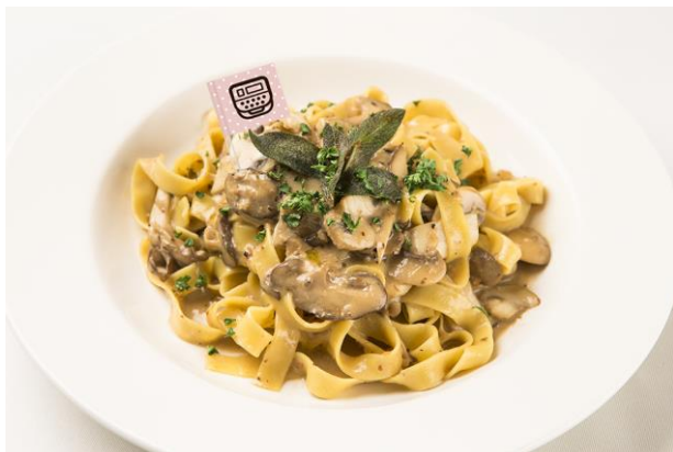
「テプラ」テープフィットチーネと フンギクリームパスタ 「テプラ」テープのようなモチモチの平打パスタ