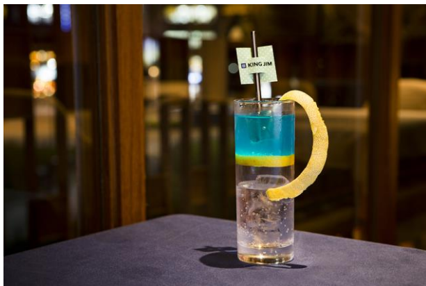
マイタイ KINGJIM スタイル キングジムカラーのブルーが鮮やかな オリジナルのノンアルコールドリンク。 飲むときは、二層のカラードリンクを混ぜて完成