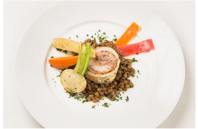
「テプラ」テープの巻き巻きボルチェッタ 「テプラ」のテープが巻かれているような ボリューム満点のメニュー