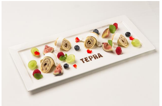
「テプラ」ルーラード カラフルフルーツ添え 「テプラ」テープのようなクルクル巻いたスイーツ