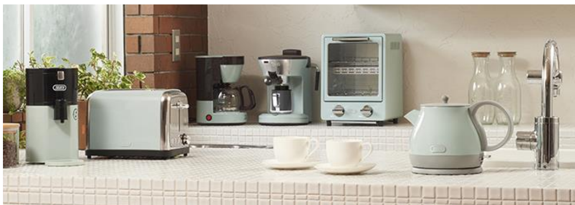
(ラドンナ Toffy キッチン家電シリーズ)