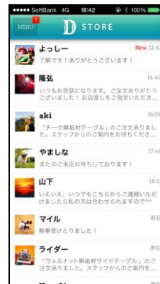
ダイレクトトーク画面（運営者側）

キングジムおよびドリームネットは、今後も全国各地における地域密着ビジネスの支援を目指して「アプスタ」のサービス向上と新機能開発に努めてまいります。