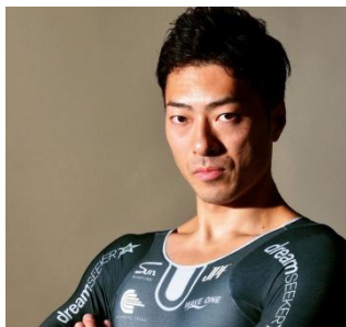
新田 祐大 (32) 日本

2018アジア大会ケイリン銀メダリスト。外国人に全く引けを取らないパワフルな走りは、「日本人は外国人にかなわない」という思い込みを忘れさせてくれる。社会貢献活動にも積極的で、自転車競技の枠を越えてスポーツ界でも交流が広く自転車競技のステイタスアップに日々奔走中。