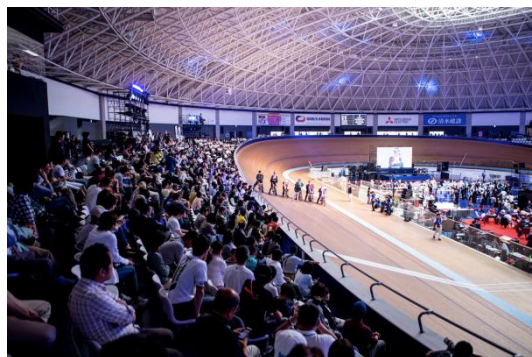
【Track Party 2017の様子】