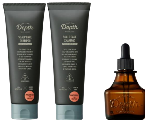
スカルプケア シャンプー (SHORT) スカルプケア エッセンス (MID-LONG)