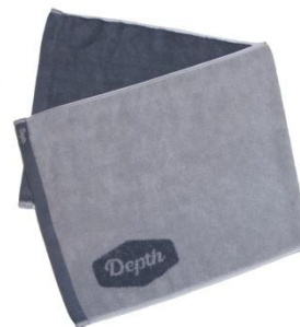
オリジナルフェイスタオル

アルビオンのエイジングケア※化粧品にも使用されている成分(環状リゾホスファチジン酸:毛髪保護)をナノキャリア社の最先端技術「ナノセスタDDS」がしっかり頭皮に届け、乾燥やストレスといった外的環境に負けない健やかでしなやかな頭皮に整えます。お風呂上りの頭皮は、水分が蒸発しやすい状態。タオルドライ後に頭皮になじませることで頭皮のうるおいを閉じ込めます。 ※年齢に応じたお手入れのこと