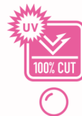
Zoff UV クリアレンズ