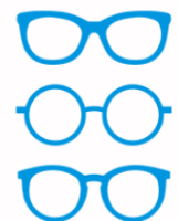
お好きなフレーム