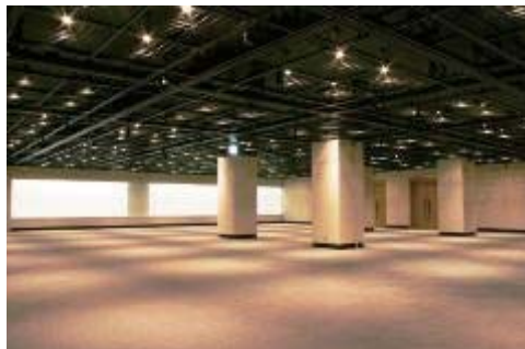
東文化会館ギャラリー