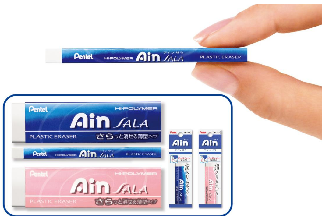
さらっと消せる薄型タイプ [消しゴム] Ain SALA(アイン サラ) 1個 ¥100+消費税 スリーブ色：ロイヤルブルー、パールピンク

ぺんてる株式会社(東京都中央区日本橋小網町7-2 社長 和田 優 TEL03-3667-3333)は、 超薄型 4.5mm の消しゴム『Ain アイン サラ SALA』を2014年1月15日より発売いたします。