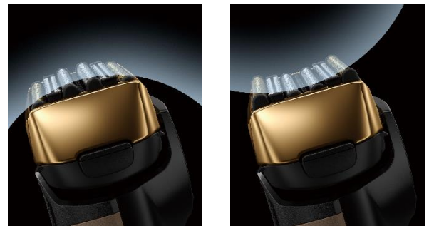
肌に立体的にフィットする「3Dフィットヘッド」