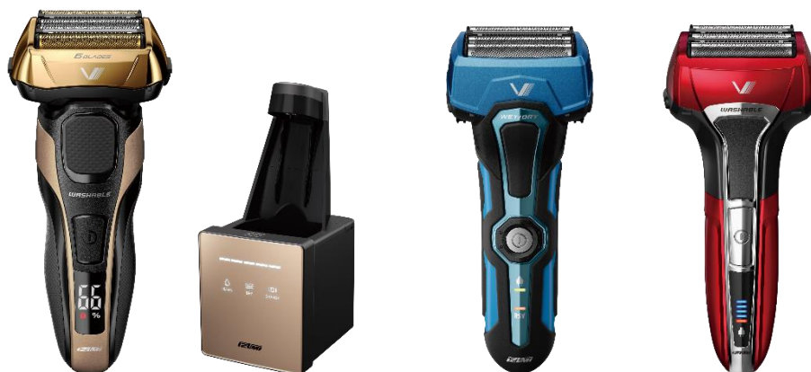
左から IZF-V990-N(6枚刃、洗浄器付き)、IZF-V750-A(4枚刃)、IZF-V570-R(5枚刃)