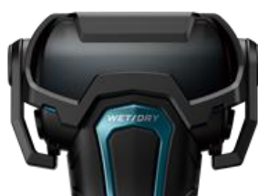
ロックレバー付きキャップ