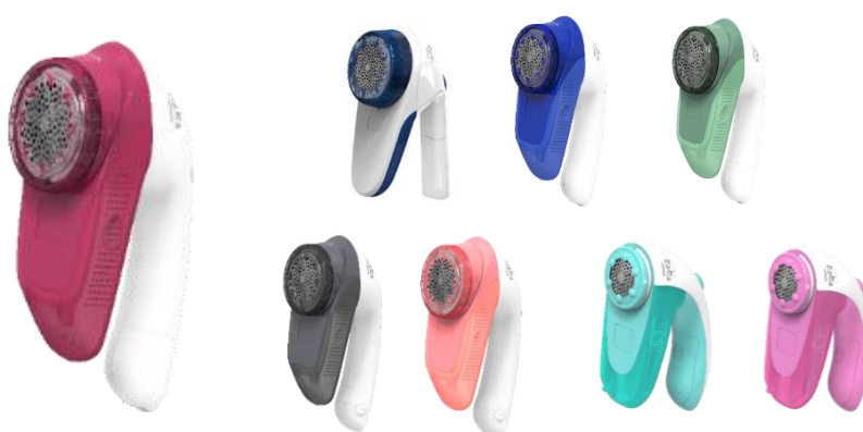
リニューアルした毛玉取り器「とるとるシリーズ」

「毛玉取り器」33年の開発研究により、刃にこだわりぬいた豊富なラインアップが登場