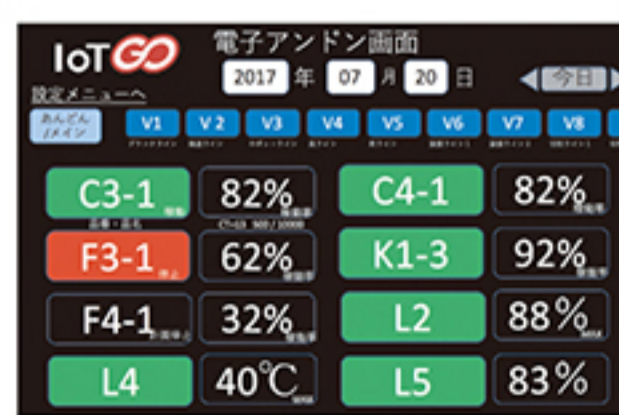
▲ IoT GO 電子アンドン画面

IoT GOの画面は、とてもシンプルです。専門知識がなくても、パッと見て情報を理解できます。