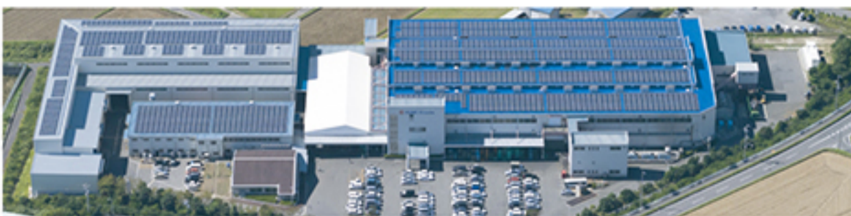
久野金属工業株式会社(愛知県常滑市)

IoT GO は、「久野金属工業株式会社(製造業)」と「株式会社マイクロリンク(クラウド開発)」が共同開発したIoTサービスです。