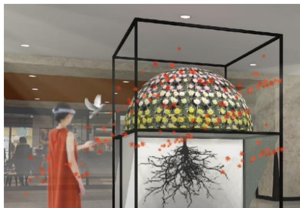
「菊 MR」体験イメージ ※実際の景色に重ねて自然の情景を3Dで表示しています