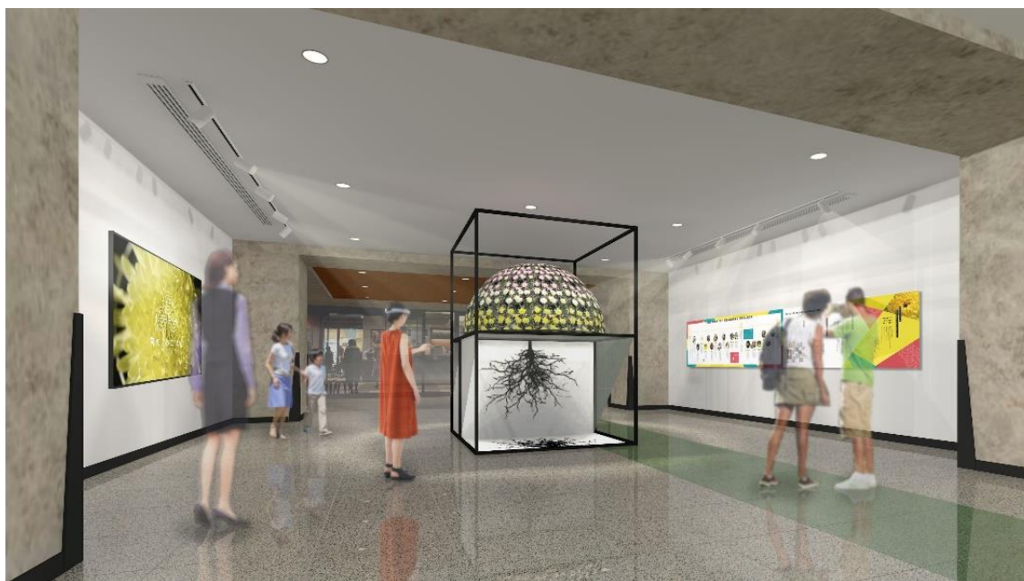
『DESIGNART TOKYO 2018』「千輪咲～ひとつながりの驚異」展示イメージ

また、花・植物に関わる日本最大の国際見本市『国際フラワー&プランツ EXPO』<2018年10月10日(水)～12日(金)>に、二本松の菊が初出展いたします。二本松の出展ブースは、日常なかなかお目にかかる事が出来ない「多輪咲」の展示を予定しております。この機会にぜひ、日本が誇る美しく圧巻の「菊」をご堪能ください。