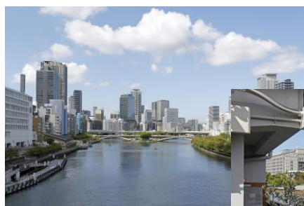
▲タワーマンションやオフィスが立ち並ぶ中之島

梅田に徒歩圏内というアクセスの良さから、タワーマンションも続々。「今後発展しそう」との期待も高い。2020年開業の「こども本の森 中之島」や美術館など文化の情報発信地としても注目され、緑豊かな中之島公園など住環境もいい。川辺に軒を連ねる洗練されたカフェやレストランも愛される理由だ。