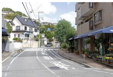
▲曲線を描く街並みの甲陽園

桜の名所として知られる夙川に沿い、自然豊かな六甲山裾に住宅街が広がる苦楽園口・甲陽園。ゆるやかな曲線を描く坂の多い街並みが印象的で、「人からうらやましがられそう」という声の通り、個性的な邸宅や高台から望む眺望も魅力的。阪神間の住宅街としてのブランド力も高い。苦楽園口駅前の並木道も美しく、パン店やお洒落な雑貨店、洋菓子店など昔から地元民に愛される店も多い。