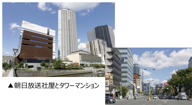
▲朝日放送社屋とタワーマンション

下町と再開発が入り混じる街。昔ながらの安くて美味しい飲食店に加え、新進気鋭のお洒落なレストランラーメン激戦区としても有名だ。JR東西線新福島駅周辺は2008年に朝日放送が移転以来、「ほたるまち」の再開発で街が活性化。JR環状線福島駅の北側エリアは、北区再開発「うめきた」の近く。朝日放送跡地はタワーマンションを建設中。JR大阪駅の北側のエリアにできる北梅田駅は2023年開業を予定。「うめきた2期」の開発も続々進行中。