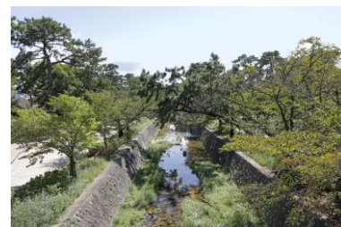
▲苦楽園口駅近くの夙川