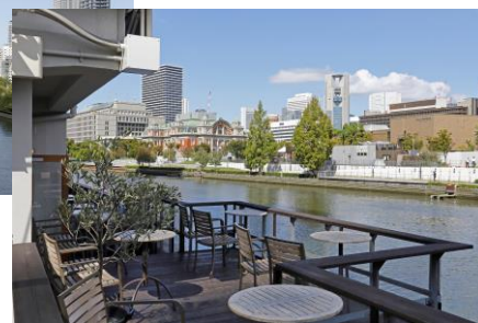
▲川辺のカフェから見える中之島の街並み