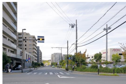
▲学研奈良登美ヶ丘駅前

近鉄けいはんな線学研奈良登美ヶ丘駅前に誕生した、比較的新しい大規模ニュータウン。自然豊かな「関西文化学術研究都市」につながる玄関口で、2013年に「近鉄学研奈良登美ヶ丘住宅地」を分譲開始し、子育て世帯が多く住まう。独自の教育システムを構築する奈良学園登美ヶ丘（幼小中高一貫校）があり、文教エリアとしても知られ、塾などの教育環境も充実している。