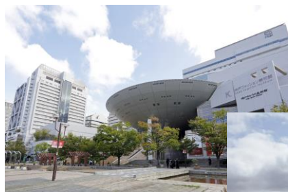
▲ファッション美術館が入ったファッションプラザと商業施設

インターナショナルスクールや外資系企業があることから、「魅力的な人たちと出会える」との声が挙がる、国際色豊かな人工島の街。「神戸ファッション美術館」などの文化施設や運動施設、商業施設がコンパクトに集約。「景観がこちよい」との評価通り、街区ごとに異なる、高層マンション群の個性的なファサードが街を彩る。海辺にはマリパークが広がり、バードウォッチングが楽しめる「野鳥園」も魅力的だ。