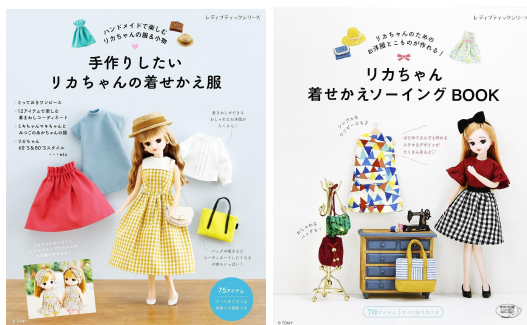
株式会社ブティック社

今後のワークショップの予定は、NewMake会員メール及びSNSなどで告知予定です。