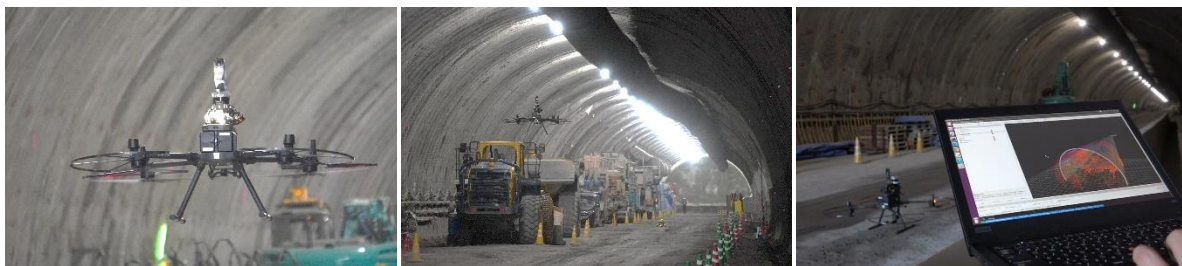
図1 トンネル坑内のドローン自律飛行

本技術は、センシンロボティクスが開発したドローンの飛行制御にLiDAR※3を使用するドローンを採用しており、非GNSS環境かつ暗所のトンネル坑内においても安全で安定した自律飛行が可能です。またドローンに搭載した360度カメラで取得した画像情報を使い、VR空間が生成できる現場モニタリングシステム「OpenSpace」※4と連携させることで建設現場の各施工段階を網羅的に記録し、BIM/CIMと併せて施工管理情報を一元化できます。これにより、関係者間での迅速な情報共有・分析を行うことが可能となり、巡視点検業務の効率化・高度化につながります。