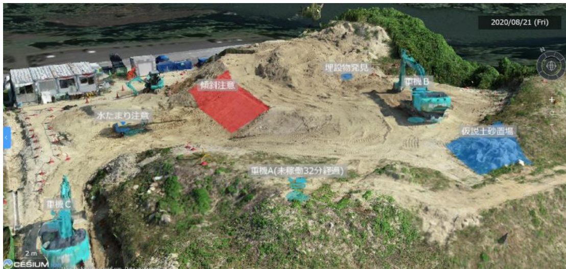
開発中の現場情報可視化イメージ (現場の状況を確認しながら円滑なコミュニケーションの実現を目指す)