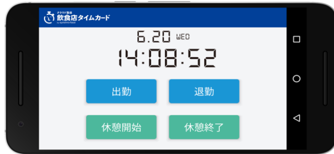
アプリ画面イメージ

スペイシーではこれまでも、飲食店のアイドルタイムを活用したワークスペース等の運営を通じ、空いてる場所を収益化する仕組みを提供してまいりました。この度の飲食店タイムカードの提供により、収益化だけではなく働き方改革にも貢献していければと考えております。