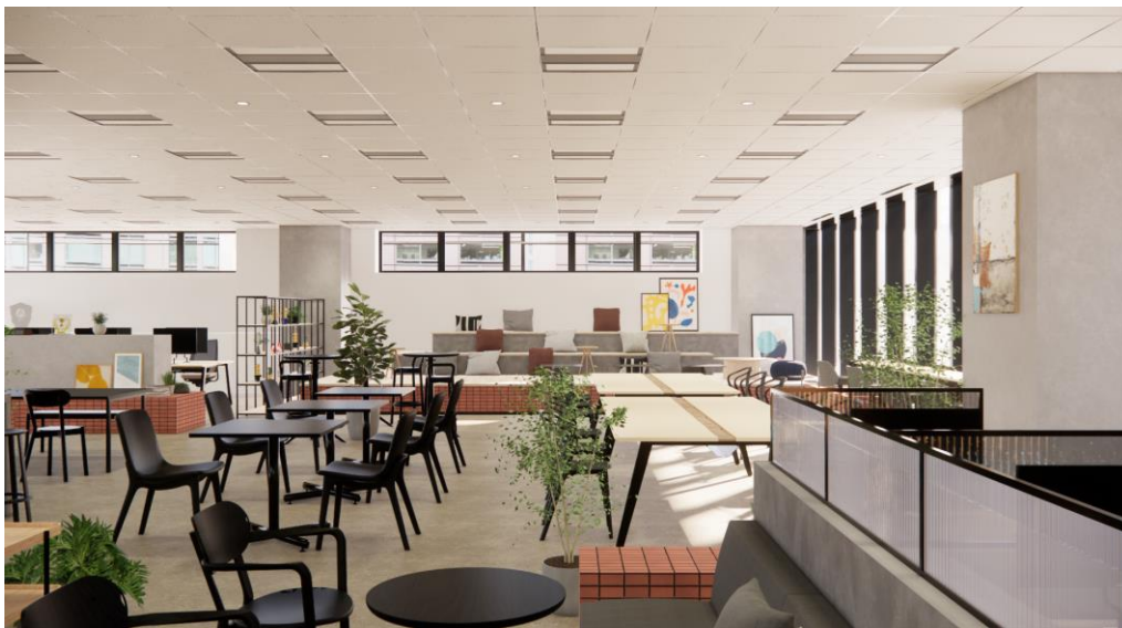
<「KAMIYACHO Connection Base」の内観イメージ>