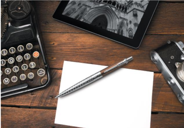
①ゴシックブラウン