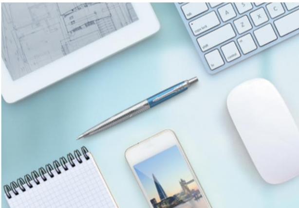
③モダンウォーターブルー