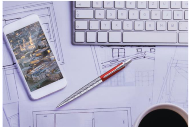
②クラシカルレッド