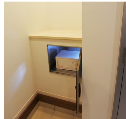
表に出ることなく宅内で荷物を回収