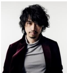
斎藤工 (TAKUMI SAITOH)

昨年劇場公開された主演作の映画『シン・ウルトラマン』、今年は『イチケイのカラス』『シン・仮面ライダー』『零落』など話題作に続々出演。2024年5月には出演作の『碁盤斬り』が公開予定。監督作の映画『スイート・マイホーム』が公開中。TBS ラジオにて朗読「深夜特急 オン・ザ・ロード」が毎週月～金曜日 23:30～23:55 放送中。