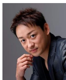
山本耕史 (KOJI YAMAMOTO)

昨年劇場公開された主演作の映画『シン・ウルトラマン』、今年は『イチケイのカラス』『シン・仮面ライダー』『零落』など話題作に続々出演。2024年5月には出演作の『碁盤斬り』が公開予定。監督作の映画『スイート・マイホーム』が公開中。TBS ラジオにて朗読「深夜特急 オン・ザ・ロード」が毎週月～金曜日 23:30～23:55 放送中。