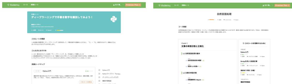
▲Aidemy の教材（左：受講ルートページ，右：受講コースページ）▲