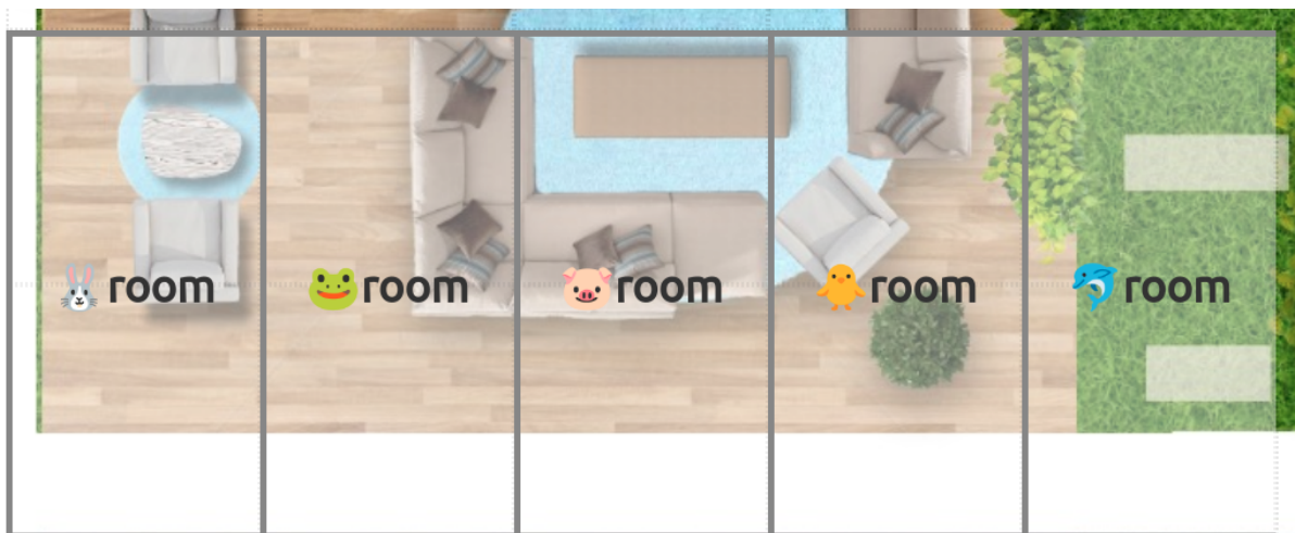
▲カウンセリングルーム▲

バーチャル学習室内は、受講者同士で自由に交流のできる自習室や、オンラインカウンセリングを実施するカウンセリングルーム等のスペースで構成されています。また、講師が待機している時間帯は、学習における不明点などを気軽に質問することができます。