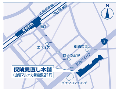
JR山陽本線「新倉敷駅」から徒歩10分